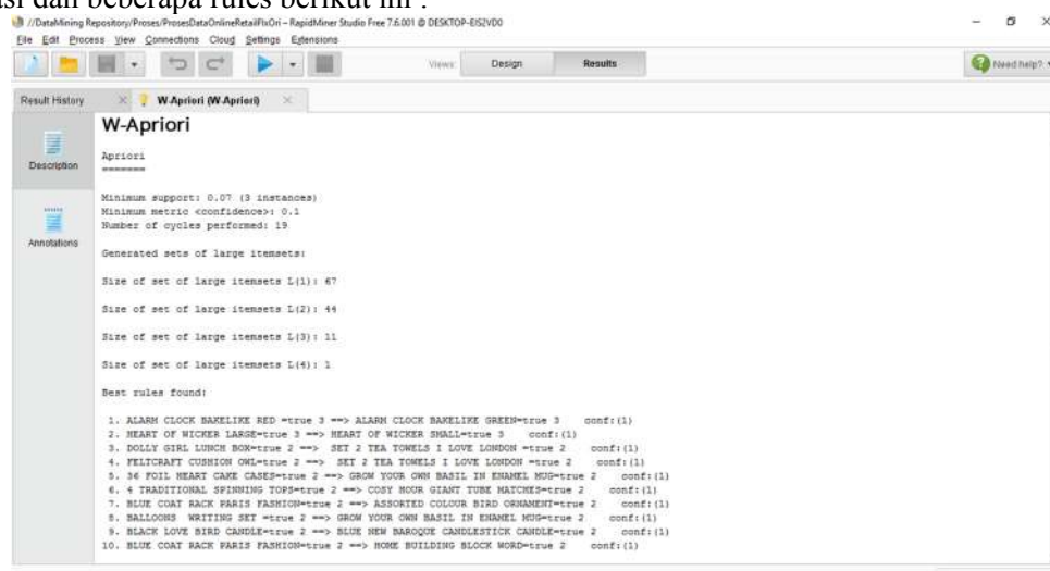
Gambar 5 Rules Hasil Simulasi RapidMiner

Dari hasil proses data menjadi data tabular pada table 3, kemudian akan diproses menggunakan aplikasi RapidMiner dengan extenstion W-apriori akan menghasilkan aturan asosiasi dan beberapa rules berikut ini .