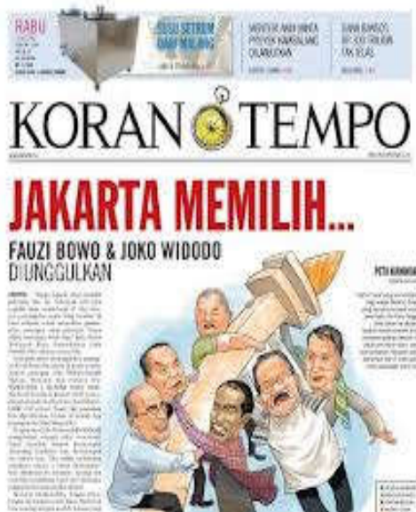
Gambar 5. Pemilikada DKI