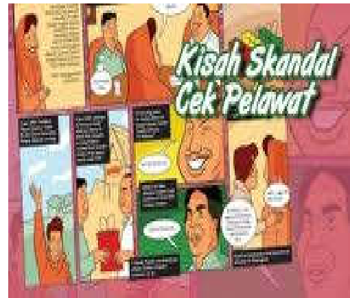
Gambar 10. Cerita skandal.