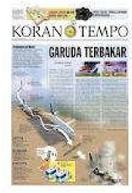
Gambar 9. Kronologis kecelakaan