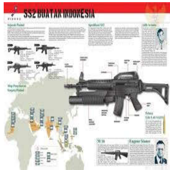
Gambar 7. Data pengguna produk