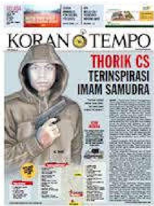
Gambar 12. Jaringan konspirasi