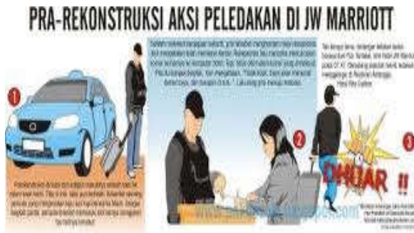
Gambar 8. Kronologis peristiwa