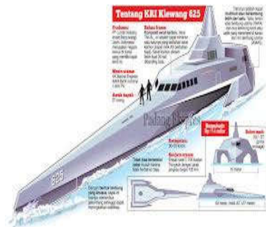
Gambar 2. Spesifikasi Kapal peren