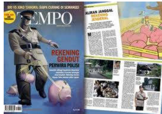
Gambar 11. Kabar korupsi