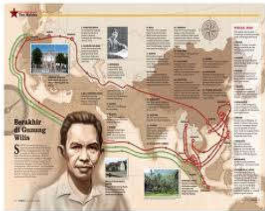
Gambar 3. Kronologis perjalanan