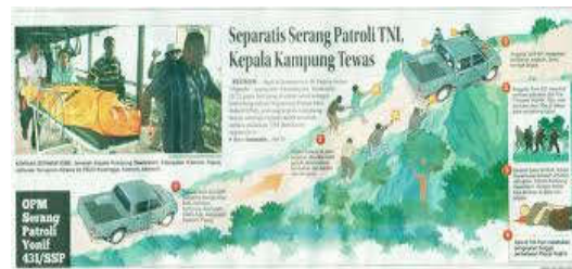
Gambar 1. Berita operasi militer

Gambar pada berikut ini bagaimana mengarahkan mata dengan cara bahasa visual. Terdapat hubungan verbal dan visual [7].