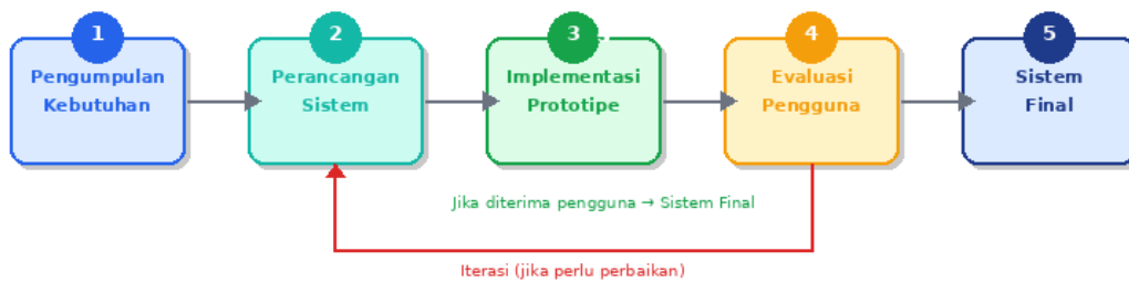
Gambar 1. Tahapan metode prototype yang digunakan

Metode Prototype dipilih karena sesuai untuk pengembangan sistem cepat dengan melibatkan pengguna secara aktif dalam evaluasi [8], [14]. Tahapan yang dilakukan ditunjukkan pada Gambar 1.