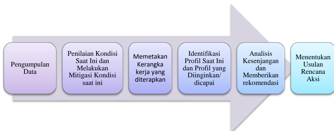
Gambar 1. Langkah-langkah penelitian

Tahapan penelitian ini meliputi Pengumpulan Data, Penilaian Kondisi Saat Ini, Melakukan Mitigasi, memetakan Kerangka kerja yang diterapkan, Identifikasi Kondisi Saat Ini dan Kondisi yang Diinginkan/ dicapai, Analisis Kesenjangan, Memberikan rekomendasi dan Menentukan Usulan Rencana Aksi.