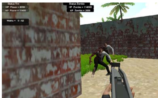
Gambar 6 Tampilan Game Ketika Zombie Menghampiri Setelah Memburu Zombie