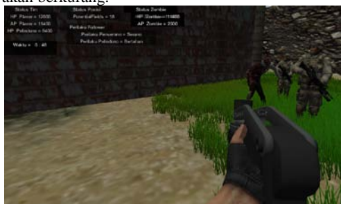
Gambar 5 Tampilan Game ketika bertemu Zombie

Kemudian selanjutnya adalah terlihat pada gambar zombie yang akan ditembak oleh player maka ketika menembak zombie maka health point dan attack point pada zombie akan berkurang.