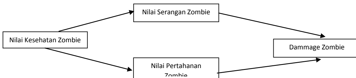
Gambar2 Alur Umum Scoring Non Player Character

Tentang produk, sistem,model, formula, rumus teori. Nama sub judul disampaikan dalam penelitian.