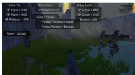
Gambar 4 Tampilan Awal Game First Person Shutter

Berikut adalah tampilan awal Game First Person Shutter ini terdapat Menu Start terdapat Level 1 dan 2. Untuk memulai klik Start di klik sekali kemudian silahkan memulai game anda dan dibawahnya ada tombol quit game untuk tombol keluar dari permainan ini.