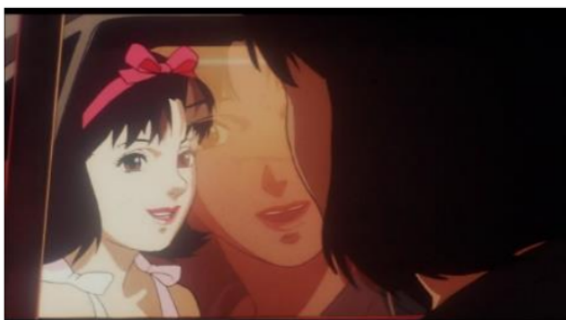
Gambar 6. Mima melihat diri Idolnya di mobil yang bergerak

Data (7) menggambarkan Mima yang melihat siluet dirinya sendiri saat masih menjadi idol di mobil yang bergerak dapat diartikan sebagai representasi simbolis dari konflik batinnya, keraguan diri, dan pengalaman derealisasi, yang sejalan dengan kriteria diagnostik gangguan derealisasi di DSM-5. Dalam adegan ini, persepsi Mima terhadap diri idolnya yang berbicara kepadanya dapat dipahami sebagai manifestasi dari pergulatan batinnya. Ungkapan yang diucapkan oleh diri idol Mima dapat diinterpretasikan sebagai ekspresi dari penilaian diri yang terinternalisasi atau representasi dari penyesalan di alam bawah sadarnya. Hal ini mencerminkan perasaannya yang bertentangan dengan pilihan kariernya, tantangan yang dia hadapi, dan disonansi antara realitasnya saat ini dan masa lalunya sebagai seorang idol. Melalui refleksi di dalam mobil yang bergerak, adegan ini menggambarkan metafora visual untuk sifat citra diri dan lingkungan sekitarnya yang terdistorsi dan berubah-ubah dengan cepat, yang merupakan ciri dari pengalaman derealisasi.