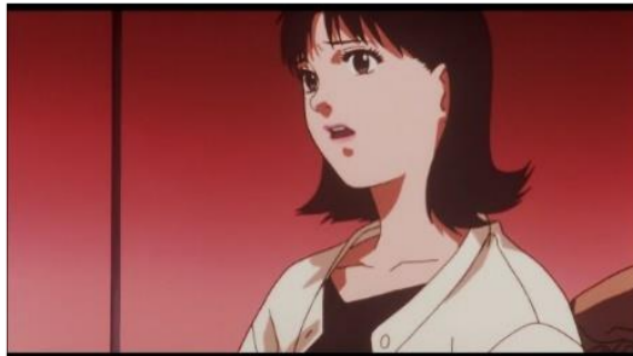
Gambar 8. Mima kaget melihat penampakan idol Mima [Sumber: Anime Perfect Blue]