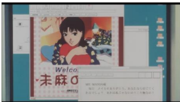
Gambar 10. Rumi berpura-pura menjadi Mima untuk berkomunikasi dengan Me-Mania

Data (14) menggambarkan Rumi yang berpura-pura menjadi Mima di situs web Mima no Heya dan berkomunikasi dengan Me-Mania melalui e-mail. Perilaku ini mencerminkan perubahan signifikan dalam perasaan Rumi tentang identitas dirinya yang sejalan dengan konsep perubahan identitas seperti yang dijelaskan dalam DSM-5.