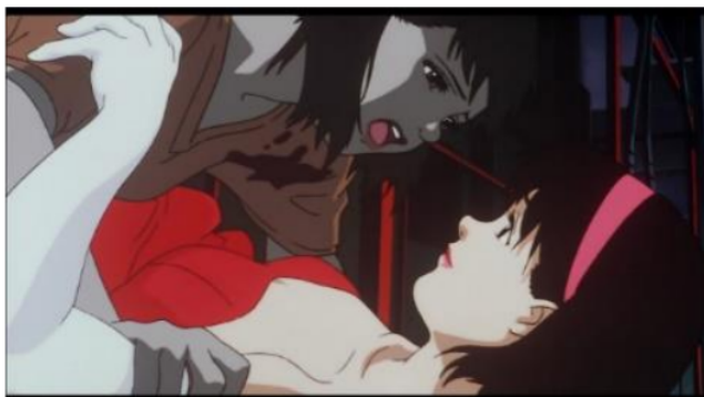
Gambar 1. Mima ingin Rumi sadar dari delusinya

みま : お願い、るみちゃんなんでしょ?!目を覚まして! Mima : Onegai, Rumi-chan nandeshou? Me o samashite! Mima : Tolong, kamu Rumi-chan kan? Tolong bangun!