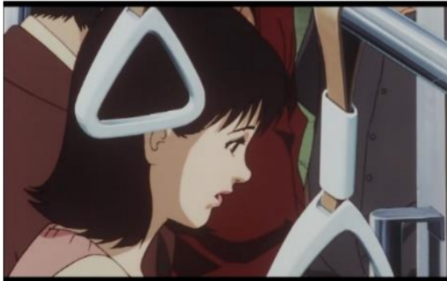
Gambar 5. Mima melamun setelah mengalami kilas balik