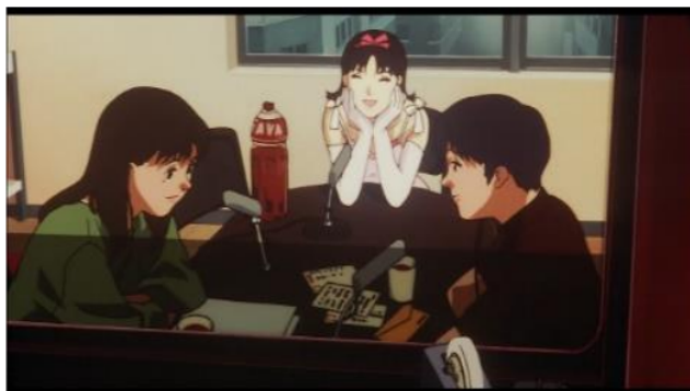
Gambar 7. Penampakan idol Mima [Sumber: Anime Perfect Blue]