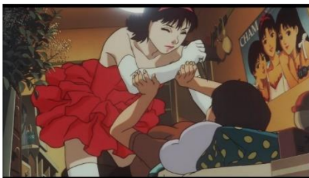
Gambar 11. Rumi mencoba membunuh Mima atas dasar kepercayaannya bahwa ia adalah Mima yang asli, dan Mima hanya ada satu