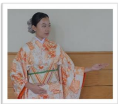
Gambar 1. こちら

ご案内いたします adalah frasa yang menggambarkan penjelasan kegiatan yang akan dilakukan oleh staf terhadap tamu, yakni staf akan mengantar tamu.