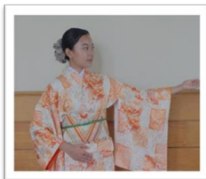
Gambar 3. あちら