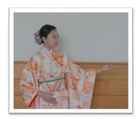
Gambar 2. そちら