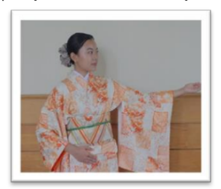
Gambar 3. あちら