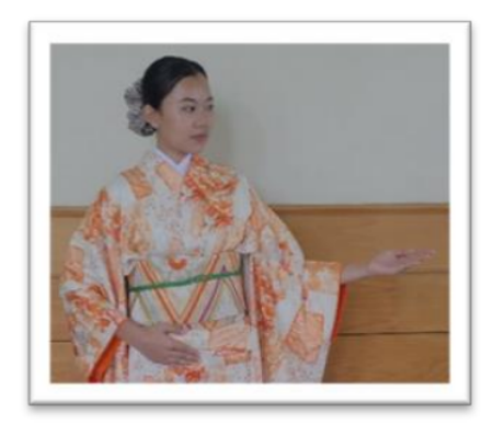
Gambar 1. こちら

ご案内いたします adalah frasa yang menggambarkan penjelasan kegiatan yang akan dilakukan oleh staf terhadap tamu, yakni staf akan mengantar tamu.