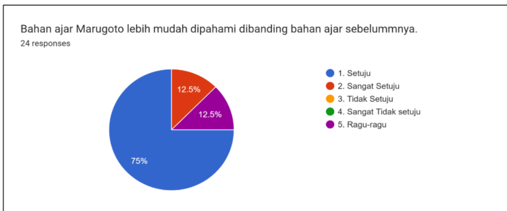
Grafik 3. Pendapat mahasiswa