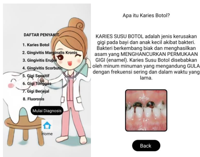
Gambar 6. User Interface halaman Glosarium Daftar Penyakit

Fitur Glosarium Daftar Penyakit memuat keterangan definisi penyakit yang terdaftar di aplikasi Toothzy seperti yang terlihat di gambar 6 dimana user dapat melihat definisi penyakit yang dipilih di halaman daftar penyakit.