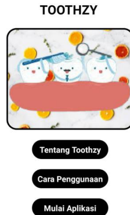
Gambar 3. User Interface halaman Home