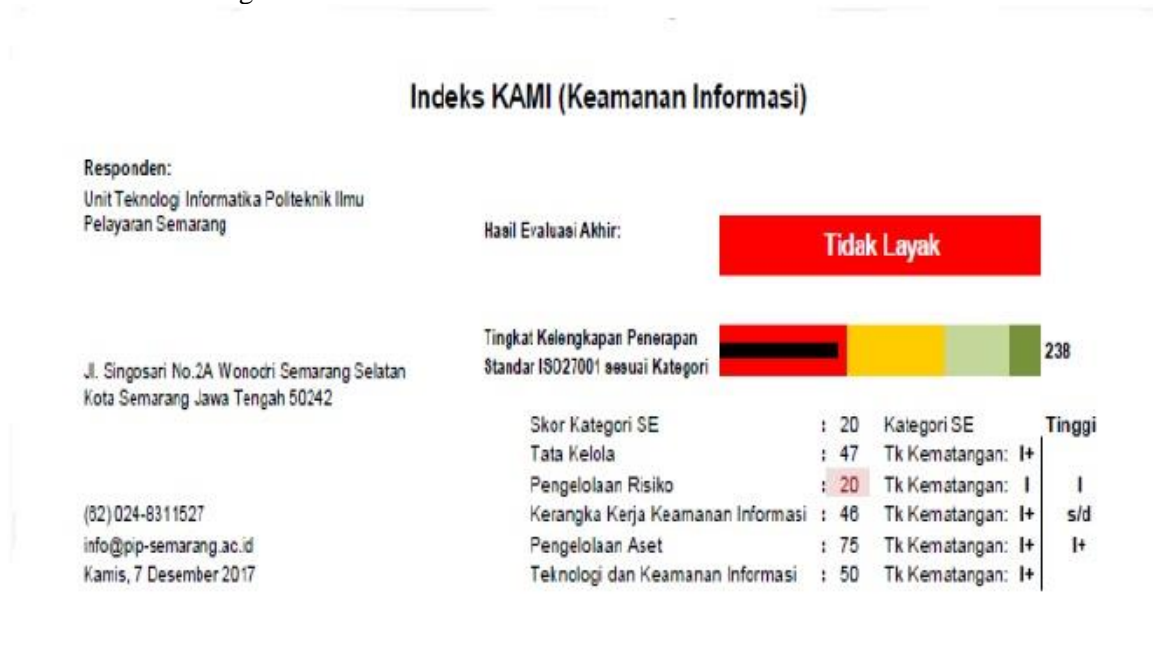
Gambar 3. Dashboard Hasil Evaluasi Indeks KAMI PIP Semarang

Berikut ini merupakan hasil dari penilaian indeks KAMI pada Politeknik Ilmu Pelayaran Semarang. Hasil tampilan dari dashboard indeks KAMI yang diperoleh adalah sebagai berikut :