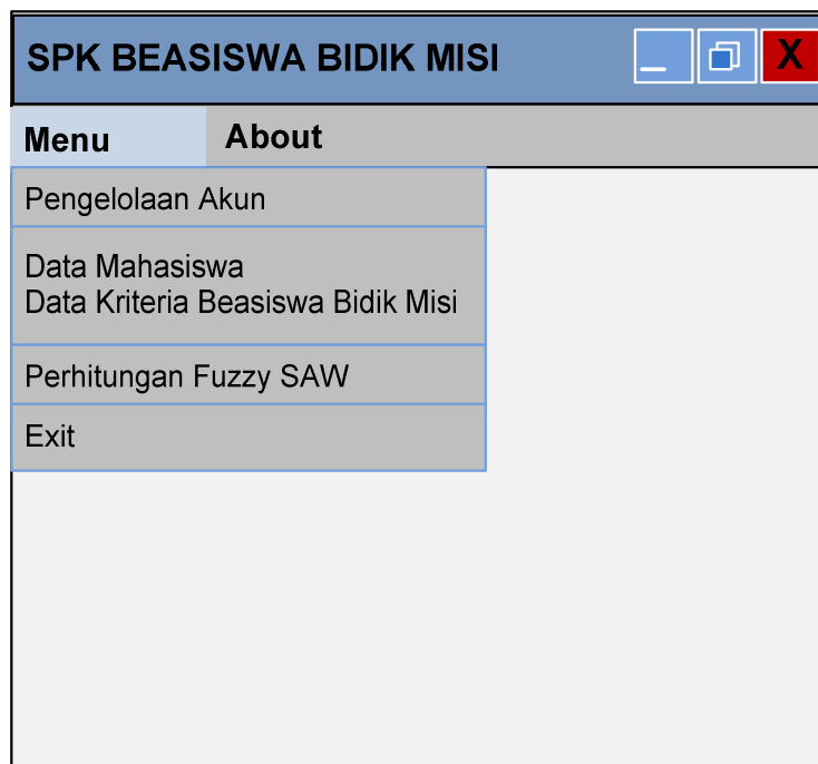
Gambar 3 Halaman Utama

Halaman utama ini berfungsi sebagai halaman depan dari aplikasi SPK penerimaan beasiswa bidik misi. Gambar hasil dari halaman utama aplikasi SPK seperti pada gambar 3.2.2.