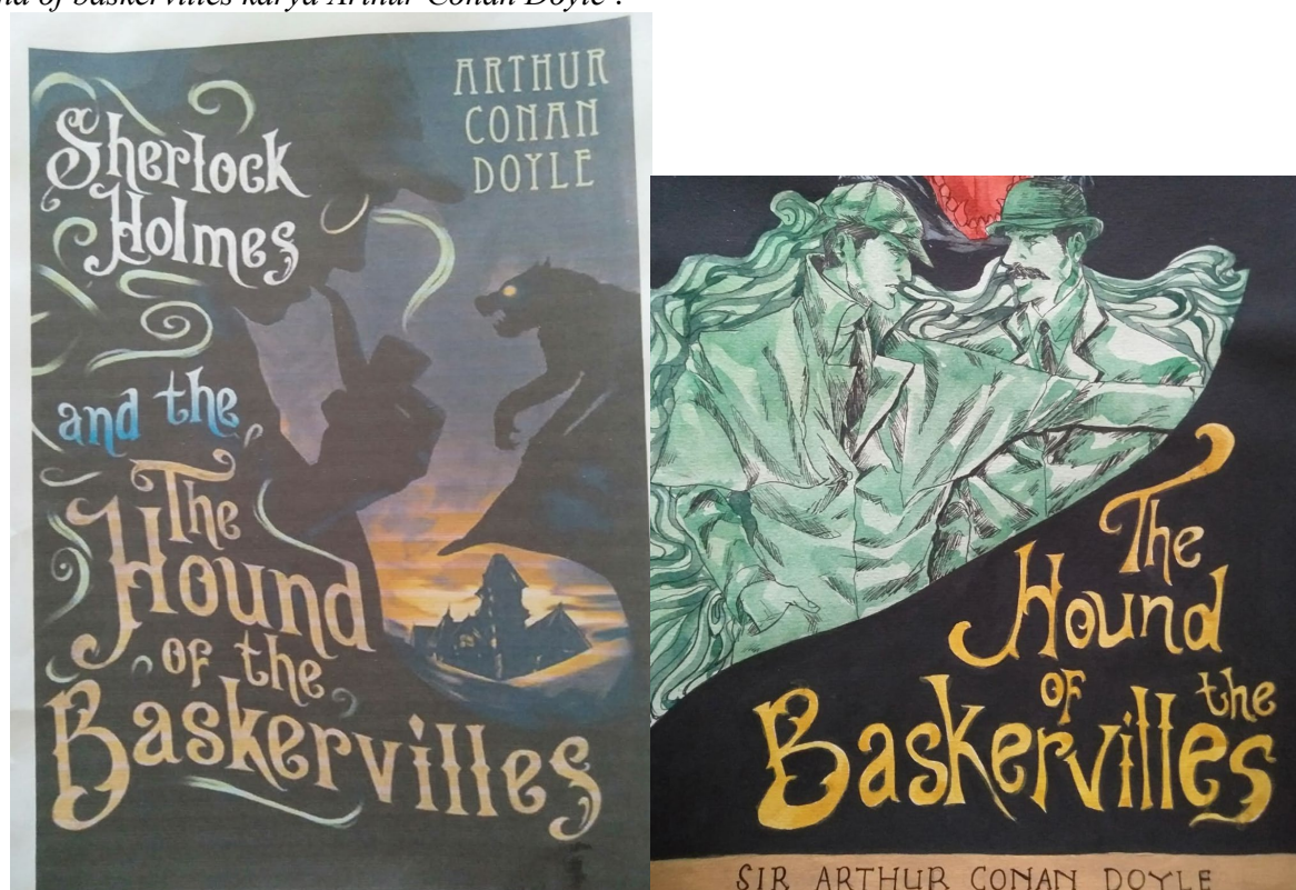
Gambar.1 Desain manual Remake Cover Novel The Hound baskerhill

divisualisasikan melalui sebuah gambar. Berikut adalah Cover novel asli dan remake cover novel "The hound of baskervilles karya Arthur Conan Doyle :