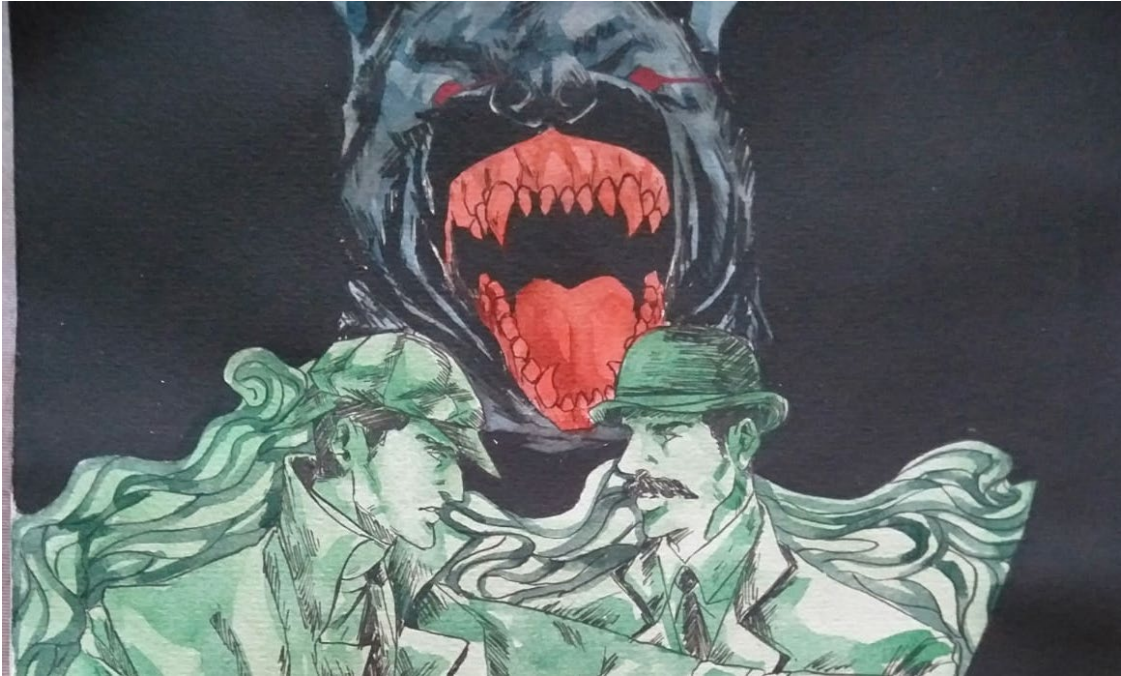
Gambar.2 Value warna padarRemake cover novel The hound of baskerville