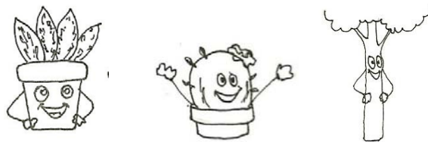
Gambar 3. 1 Sketsa Karakter

Penggunaan ilustrasi dan desain interface yang ceria bertujuan memberikan ketertarikan ( user experience ) dalam menggunakan aplikasi. Pemilihan warna cenderung menggunakan warna-warna kontras pada bagian tertentu agar suatu objek dan tombol dapat terlihat dengan jelas. Sehingga dalam menggunakan aplikasi ini ramah digunakan target audience