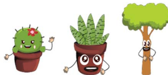
Gambar 3. 4 Desain Karater