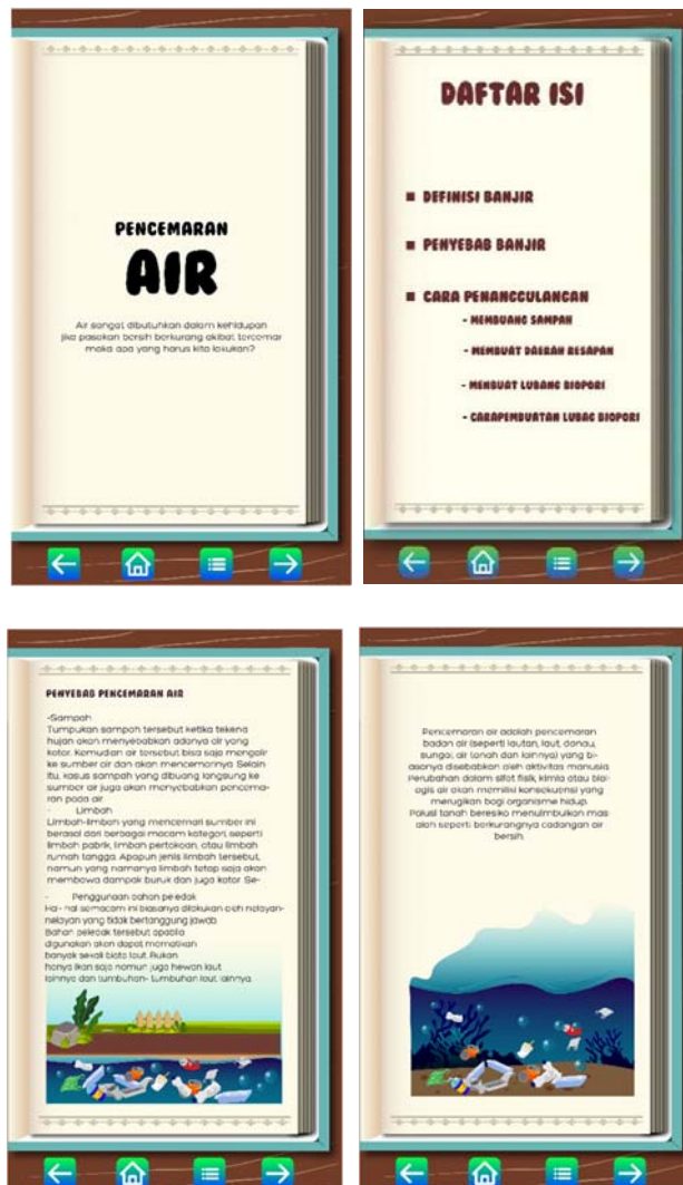
Gambar 3. 9 Desain Tampilan Materi pada Aplikasi