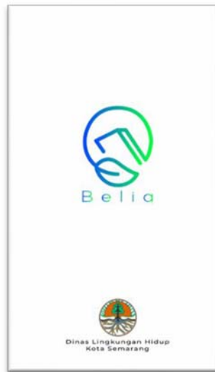
Gambar 3. 6 Pengaplikasian Desain Splash Screen