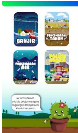
Gambar 3. 8 Tampilan Menu Aplikasi