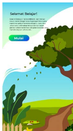
Gambar 3. 7 Pengaplikasian Desain Environment pada Aplikasi