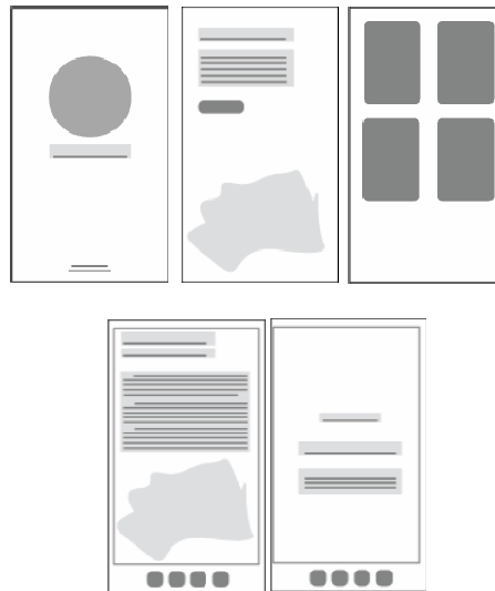
Gambar 3. 3 Sketsa Lay Out

Desain environment (lingkungan latar) pada aplikasi diletakan pada bagian tertentu, yaitu pada susunan materi sebagai pendukung penggambaran pesan dan terpasang pada beberapa fitur. Penggambaran yang diambil merupakan suasana yang dekat dengan lingkungan masyarakat sekitar dan objek-objek yang akrab di kalangan masyarakat khususnya pada target audience .