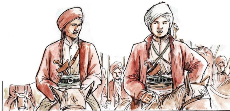
Gambar 3.1 Refrensi karakter visual dan ilustrasi materi gambar