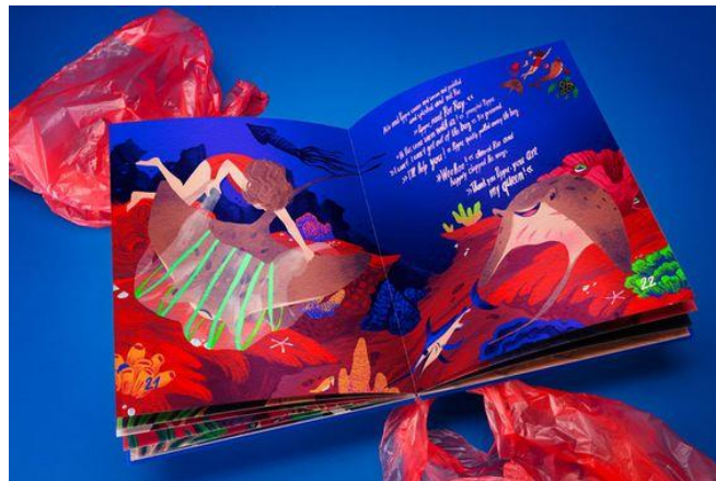
Gambar 3.2.3 Referensi layout ilustrasi

Layout pada buku ilustrasi ini akan menggunakan layout dengan komposisi berupa gambar ilustrasi pada setiap dua lembar halaman ditambah dengan tipografi sebagai penjelas dari gambar ilustrasi.