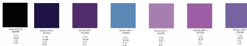
Gambar 3. Konsep Penggunaan Warna

Buku ini memiliki tema Luar Angkasa, sehingga penggunaan warna akan disesuaikan dengan penggambaran yang telah diambil oleh para ilmuwan atau astronot. Warna dominan yang akan digunakan adalah ungu, biru dan hitam. Terdapat juga beberapa warna tambahan yaitu seperti kuning, coklat, merah dan putih, untuk memberikan kesan yang fun karena pada umur 9-12 tahun anak menyukai warna-warna cerah.