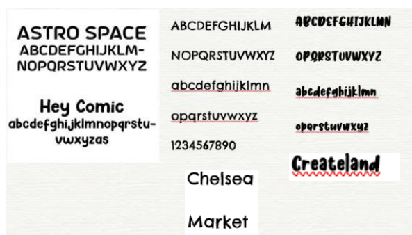
Gambar 4. Jenis Font yang Digunakan

Penggunaan tipografi juga disesuaikan dengan tema buku dan target utama penulis. Menggunakan font sans serif pada semua bagian dari judul hingga isi buku, agar lebih mudah dibaca. Terdapat empat font yaitu Astro Space, Helsea Market, Creatland, dan Hey Comic.