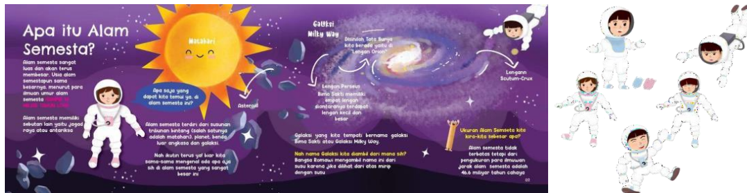
Gambar 2. Key visual

Key Visual yang ditampilkan adalah warna yang digunakan seperti biru, ungu, dan hitam. Warna ini akan muncul hampir di setiap halaman, karena warna ini merupakan gambaran luar angkasa yang indah. Maskot juga menjadi salah satu key visual, yang akan muncul di setiap halaman yang berfungsi untuk memberikan informasi atau fun fact tentang pembahasan yang dibahas setiap halaman dan gimmick .