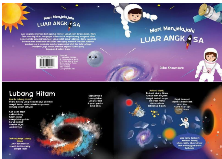
Gambar 7. Judul, Cover, dan Isi Buku

Grid yang akan digunakan pada perancangan buku ini adalah Hierarchical grid digunakan karena penempatan teks dan gambar tidak beraturan, grid ini biasanya digunakan pada buku cerita anak-anak. Menggunakan grid ini akan mempermudah penempatan tata letak buku. Layout yang digunakan adalah Circus Layout . Tatanan pada Circus Layout tidak beraturan, akan terdapat ilustrasi yang besar dan juga diikuti beberapa headline. Penggunaan layout tersebut dikarenakan ingin memberikan konsep yang imajinatif dan fun. Karena spreadsheets , sehingga pada tulisan dan ilustrasi memiliki bobot yang berbeda.