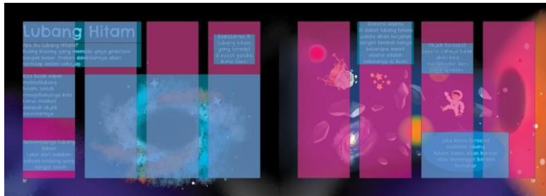
Gambar 6. Layout dan Grid

Buku interaktif akan menggunakan gaya ilustrasi seperti kartun, berdasarkan moodboard yang telah tersusun. Hal ini bertujuan agar membuat buku aktivitas menarik dan tidak terlihat monoton. Pada berbagai planet dan bintang akan terdapat unsur manusiawi seperti mata dan mulut, dikarenakan mereka dapat bertumbuh dan memberikan kesan yang dapat menarik minat anak. Penerapan proporsinya adalah 70% gambar dan 30% teks. Dimana anak-anak lebih tertarik terhadap gambar dibandingkan sebuah teks. Dimana setiap halaman memiliki pembahasan yang berbeda, dengan halaman orientasi yang landscape .