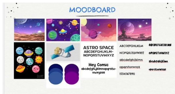
Gambar 1. Moodboard

Pada proses berpikir yang telah dilakukan maka dalam perancangan ini, penulis menciptakan mood agar memberikan kesan buku ilustrasi yang fun dan alam. Dengan menciptakan mood yang fun, anak-anak akan enjoy dalam membaca dan berinteraksi dengan buku tersebut, sehingga memberikan kesan nyaman. Buku ini mengilustrasikan mengenai alam semesta yang merupakan ciptaan alami. Mengambil berbagai contoh gambaran ilustrasi planet, galaksi, dan sebagainya yang diubah menjadi gaya ilustrasi kartun. Sifat anak-anak yang menyukai kartun sangat cocok dengan penyampaian buku tersebut.