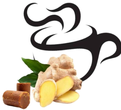
Gambar 9. Desain Final Ilustrasi Isi Produk

Desain kemasan yang berisi informasi yang ingin disampaikan kepada para konsumen. Penting sekali memperhatikan keselarasan antara informasi yang ingin disampaikan dan keindahan kemasan yang proporsional sehingga menciptakan desain kemasan yang menarik. Pada bagian depan kemasan tentu saja mencantumkan nama produk, selain itu ada berat bersih, logo resmi produk halal, ilustrasi isi produk, dan tidak lupa menambahkan logo identitas UMKM “Berkah” itu sendiri. Penulis mencoba membuat desain kemasan pada bagian depan terlihat sederhana dan elegan. Sedangkan pada bagian belakang kemasan terdapat tagline atau beberapa kata yang mengandung deskripsi produk, komposisi, cara penyajian produk, saran penyimpanan, expired date , serta kode produksi.