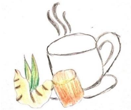
Gambar 8. Sketsa Manual

Penulis juga membuat sketsa manual terlebih dahulu terkait ilustrasi gambar produk. Sketsa dibuat atas dasar sebagai penggambaran citra atas hal yang ingin disampaikan melalui bentuk gambaran secara singkat dan sederhana. Desain kemasan produk menggunakan ilustrasi yang menggambarkan gula jahe yang diseduh, pola desain ilustrasi dibuat berupa cangkir dengan sedikit pola asap, jahe, dan gula jawa. Ilustrasi ini dipilih berdasarkan saran penyajian yang diseduh air panas serta komposisi yang terbuat dari jahe dan gula jawa.