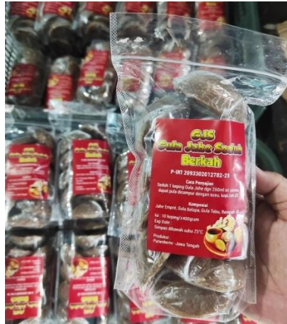
Gambar 2. Kemasan Produk Sebelumnya

Selanjutnya ada beberapa saingan kompetitor yang bergerak pada produk olahan jahe yaitu sirup jahe “Bu Husnul” yang berdiri sejak tahun 2000 dan sirup jahe “Mbayu”. Kedua produk tersebut termasuk home industry yang di dalamnya anggota keluarga dan sanak saudara saling bekerja sama dalam proses produksi. Dengan ketelatenan yang ulet dan tidak takut akan tantangan berbisnis usaha, kedua produk ini banyak orang yang berlangganan. Produk sirup jahe “Bu Husnul” ditemukan di warung, pasar, bahkan ankringan di Purwokerto. Sedangkan sirup jahe “Mbayu” ini pun mencoba menjajakan produknya di marketplace yang dirasa prosesnya sekarang cukup mudah.