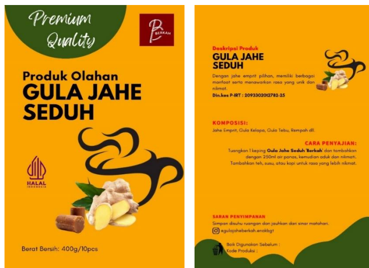
Gambar 10. Desain Final Label Kemasan

Desain kemasan yang berisi informasi yang ingin disampaikan kepada para konsumen. Penting sekali memperhatikan keselarasan antara informasi yang ingin disampaikan dan keindahan kemasan yang proporsional sehingga menciptakan desain kemasan yang menarik. Pada bagian depan kemasan tentu saja mencantumkan nama produk, selain itu ada berat bersih, logo resmi produk halal, ilustrasi isi produk, dan tidak lupa menambahkan logo identitas UMKM “Berkah” itu sendiri. Penulis mencoba membuat desain kemasan pada bagian depan terlihat sederhana dan elegan. Sedangkan pada bagian belakang kemasan terdapat tagline atau beberapa kata yang mengandung deskripsi produk, komposisi, cara penyajian produk, saran penyimpanan, expired date , serta kode produksi.