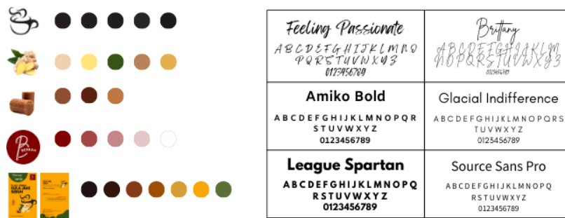
Gambar 11. Warna dan Tipografi Kemasan