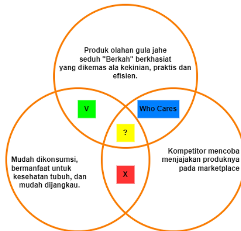
Gambar 5. Analisis USP Produk Olahan Jahe

Dengan adanya USP memerankan peran penting agar dasar suatu produk dapat terlihat unik dan berbeda dari kompetitor produk lainnya. Sehingga nantinya pemilik produk olahan gula jahe seduh “Berkah” melalui produknya dapat menyampaikan pesan dengan baik dan dirasa efektif. Penulis mencoba menerapkan analisis Unique Selling Proposition dengan produk milik pesaing yang ada di Purwokerto.