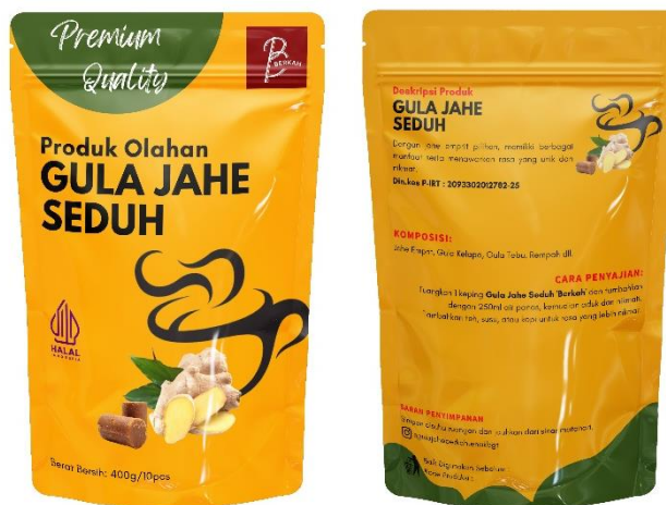
Gambar 13. Final Desain Kemasan Digital

Terakhir, pada tahap pengujian dilakukan kepada pemilik dan konsumen selaku penikmat produk olahan gula jahe seduh “Berkah”. Pengujian dilakukan secara kualitatif dengan wawancara kepada Bapak Dedi selaku pemilik dan 5 orang responden selaku konsumen dari produk ini. Pengujian pertama kepada Bapak Dedi terkait desain kemasan yang telah melalui proses rebranding . Desain kemasan tersebut mencakup logo, ilustrasi isi produk, maupun konten grafis lainnya berupa desain digital. Pengujian ini menghasilkan respon yang positif dan sudah sesuai dengan keinginan kebutuhan yang ada pada UMKM ini. Desain kemasan terlihat lebih berwarna dan menciptakan keselarasan yang belum pernah ada sebelumnya. Kemasan ini nantinya mampu bersaing pada pangsa pasar yang lebih luas, tidak hanya pada lingkup kota Purwokerto.