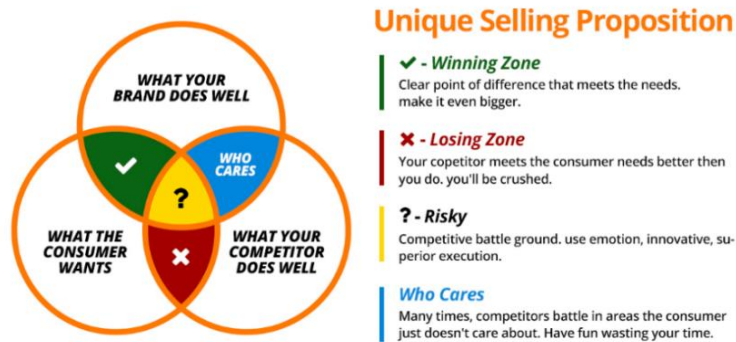
Gambar 4. Bagan Unique Selling Proposition

Analisis USP dirasa penting untuk mengetahui bagaimana nilai produk yang dimiliki, sehingga posisi produk tetap berada dalam pangsa pasar yang tepat. Pemilik bisnis usaha harus memikirkan dan mempertimbangan strategi akan masalah yang akan terjadi nantinya.