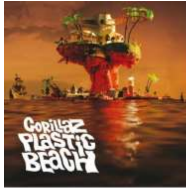
Gambar 11. Album art Gorillaz 'Plastic Beach'

Daya tarik visual Gorillaz sendiri bisa muncul dari latar belakang karakter yang bisa di realisasikan melalui ilustrasi. Di dunia animasi, perancangan desain karakter protagonis dan antagonis harus berbeda agar penonton dapat membedakan peran mereka. Desain karakter bisa dibongkar dalam bentuk elemen-elemennya, seperti palet warna, bentuk, ciri-ciri visual, bahkan gestur tubuh. (Datau & Murwonugroho, 2020). Hal ini di terapkan pada desain karakter anggota Gorillaz yang memiliki latar belakang tidak baik, baik dengan masa lalunya ataupun satu sama lain. Contohnya adalah latar belakang vokalis utama Gorillaz, 2-D yang memiliki nama asli Stuart. Rambut Stuart yang berwarna biru tua disebabkan oleh kecelakaan saat dia berumur 11 tahun. Ia jatuh dari pohon yang menyebabkan rambut aslinya yang berwarna coklat rontok, dan tumbuh menjadi rambut biru tua yang sekarang ia miliki.