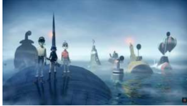
Gambar 8. Visual buatan untuk Musik Video Gorillaz 'On Melancholy Hill'

Contohnya adalah musik video untuk lagu Gorillaz berjudul On Melancholy Hill. Di musik video ini banyak visual serta jalan cerita yang unik. Di ceritakan, anggota Gorillaz, Noodle berusaha dibunuh oleh helikopter Boeing-Sikorsky RAH-66 Comanche dan AH-64 Apache. Menurut teori universe Gorillaz, helikopter ini adalah helikopter yang sama pada musik video Feel Good Inc. , yang menandakan Noodle sudah diincar sejak lama. Pernyataan bahwa El Mañana dan Feel Good Inc. , ada pada universe yang sama terlihat dari kincir angin yang ada pada kedua musik video. Banyak visual yang tidak mungkin terjadi di dunia nyata dapat direalisasikan dalam universe Gorillaz.