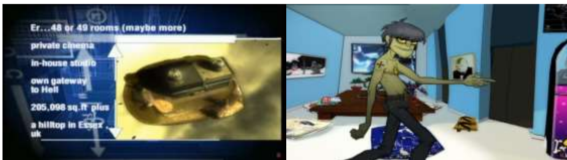
Gambar 7. Visual tempat tinggal Gorillaz di MTV Cribs

Universe atau disebut juga dunia yang ditinggali anggota fiksi Gorillaz bisa dikatakan sebagai parallel universe . Dunia yang dibuat untuk Gorillaz ini juga memiliki visual yang dicocokkan dengan konsep Gorillaz itu sendiri. Salah satu contohnya adalah dengan adanya tur rumah Gorillaz yang ditayangkan di MTV Cribs.