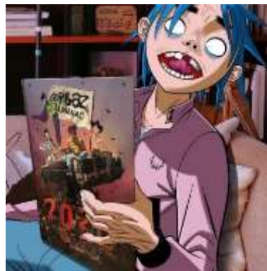
Gambar 3. Stuart Harold "2-D" Pot