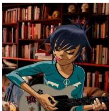
Gambar 5. Noodle

Murdoc Faust Niccals atau pemilik nama lahir Murdoc Alphonse Niccals adalah pemain bass dari Gorillaz. Suara Murdoc diisi oleh Phil Cornwell. Di dunia Gorillaz, Murdoc bertanggung jawab atas konsep dan formasi band. Di dunia yang sama, Murdoc tidak menyukai vokalis Gorillaz, 2-D. Karakter Murdoc dibuat berdasarkan gitaris Keith Richards dari The Rolling Stones, Victor Frankenstein, dan Creeper dari Scooby Doo . Secara detail, cara berpakaian dan gaya Murdoc dibuat terinspirasi oleh Ozzy Osbourne dari band rock Black Sabbath. Hewlett memasangkan Murdoc dengan konsep “penjahat yang tidak menyenangkan” di dalam band.