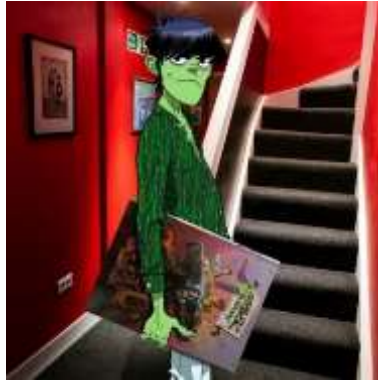
Gambar 4. Murdoc Faust Niccals