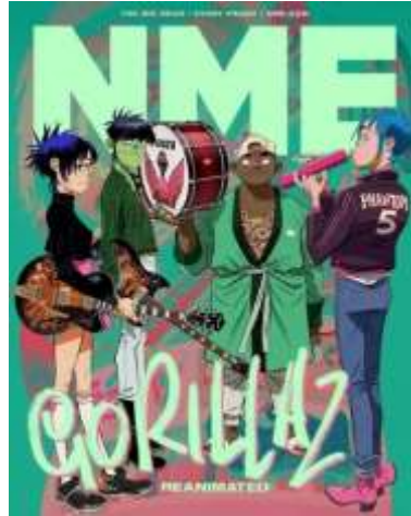
Gambar 2. Desain Karakter Band Gorillaz

psikologis, sosiologis. Aspek fisiologis membahas dari segi tampilan fisik tokoh, psikologis berdasarkan latar belakang dari diri tokoh, dan sosiologis berdasarkan kondisi sosial atau lingkungan yang ada di sekitar tokoh (Florence, 2018). Hal-hal tersebut harus terlihat dari desain, karena audiens tidak memiliki skrip mengenai karakter tersebut. Biasanya, akan digunakan stereotip dan karakteristik tertentu yang melekat sebagai alat.