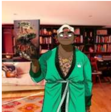
Gambar 6. Russel Hobbs

dengan karakter yang biasa dibuat Hewlett. Dengan usul Albarn untuk membuat karakter yang berbeda, Hewlett membuat karakter Noodle sebagai anak berkebangsaan Jepang yang berumur 10 tahun.