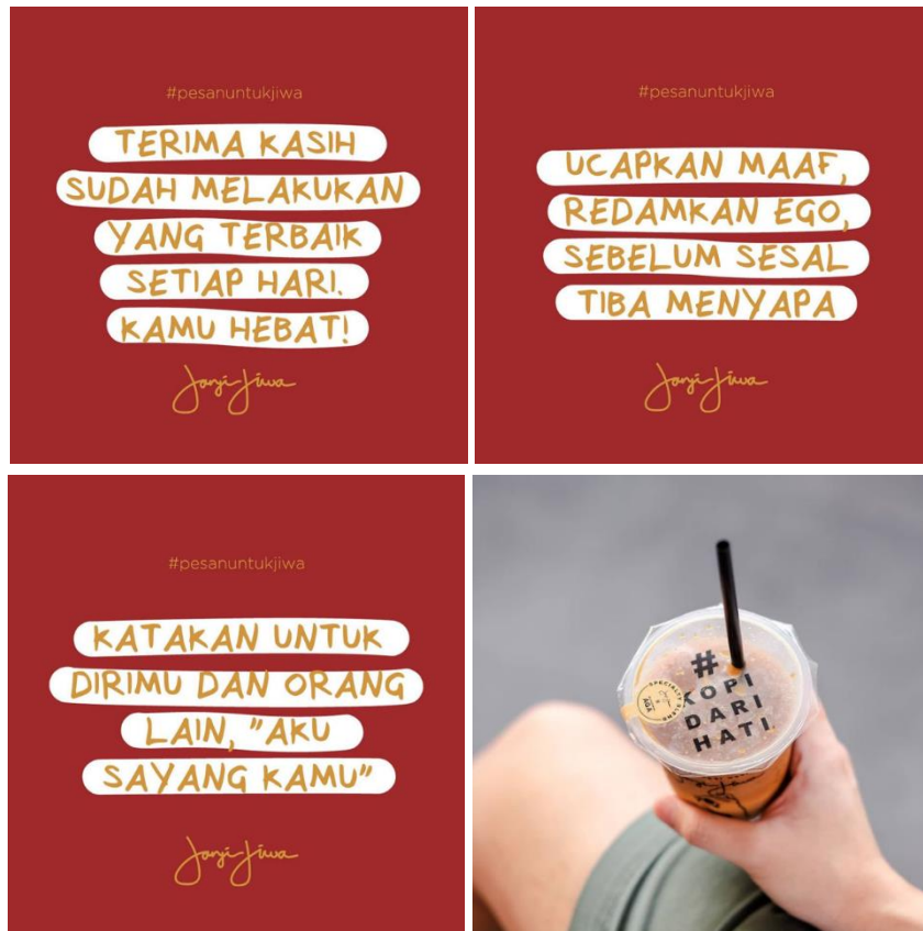
Gambar 2. Kemasan Kopi Janji Jiwa dan Teksnya.

Berdasarkan observasi, maka diambil empat buah teks yang terdapat pada kemasan Janji Jiwa seperti pada gambar 2. Teks-teks tersebut adalah sebagai berikut: “Terima kasih sudah melakukan yang terbaik, kamu hebat!” (posisi di bagian tutup kemasan), “Katakan untuk dirimu dan orang lain, ‘aku sayang kamu’.” (tutup), “Ucapkan maaf, redamkan ego, sebelum sesal tiba menyapa.” (tutup) dan “Sebuah cerita tentang jiwa, menepati janji secangkir kopi.” (badan).