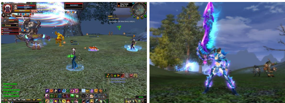
Gambar 2. Game Online Perfect Word yang menciptakan motivasi pemain untuk selalu meningkatkan kemampuan karakternya baik untuk alasan harga diri ataupun ekonomi

Contoh kasus lain misal dalam online game seperti Perfect World , sifat kecanduan pemain dibentuk dengan motivasi pemain untuk meningkatkan level karakternya setinggi-tingginya sehingga mendapat penghargaan dari pemain lain sebagai karakter yang disegani. Selain itu terdapat juga motivasi ekonomi dari pemain, yaitu dengan menjadikan level karakternya setinggi mungkin akan meningkatkan nilai harga jual karakternya, karena dalam permainan ini dikenal jual beli karakter game . Mereka yang memiliki karakter dengan level paling tinggi akan merasa memiliki martabat yang tinggi