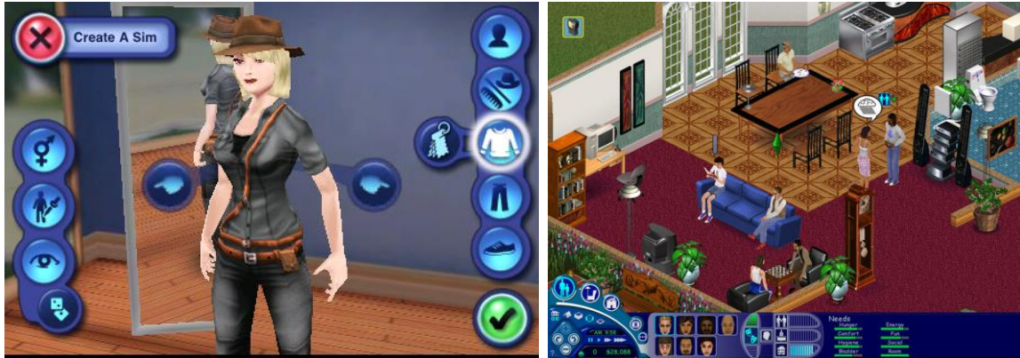
Gambar 3. Game Online The Sims yang memberikan simulasi kehidupan sehari-hari kepada pemain, sehingga pemain dapat bermain sebagai dirinya yang diinginkan (Sumber : http://sims.wikia.com/wiki/The_Sims )

pemain akan merepresentasikan kehidupan yang diinginkannya atau yang ingin dicapainya misal dari segi kebutuhan fisiologi (rumah, mobil, dll) bahkan segi asmara (percintaan).