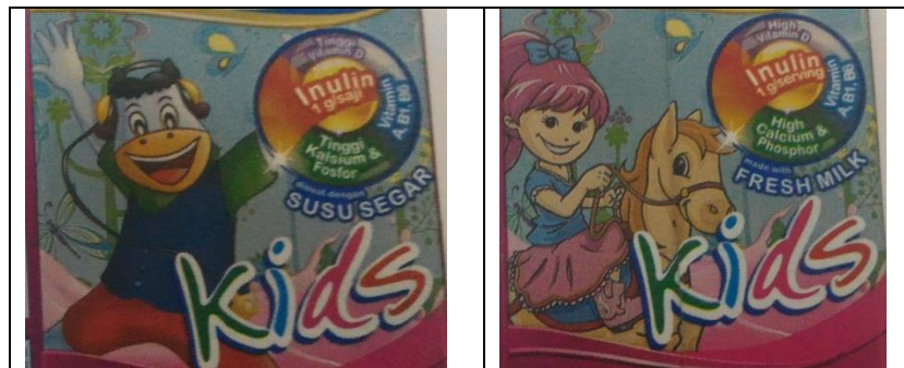
Gambar 3. Visualisasi Gambar Animasi Indomilk Kids rasa stroberi

Sementara pada susu Boneeto terlihat bagaimana maskot produk ini yang bernama Calcin (kependekan dari kalsium) tengah asyik bermain basket bila ingin tumbuh tinggi seperti pesan utama yang ingin diangkat dalam promosi susu Boneeto sebagai susu pertumbuhan bagi anak-anak. Olahraga Basket identik dengan olahraga yang memerlukan postur badan tinggi bagi pemainnya.