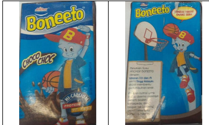
Gambar 2. Visualisasi Gambar Animasi Boneeto rasa Coklat

Sementara pada susu Boneeto terlihat bagaimana maskot produk ini yang bernama Calcin (kependekan dari kalsium) tengah asyik bermain basket bila ingin tumbuh tinggi seperti pesan utama yang ingin diangkat dalam promosi susu Boneeto sebagai susu pertumbuhan bagi anak-anak. Olahraga Basket identik dengan olahraga yang memerlukan postur badan tinggi bagi pemainnya.