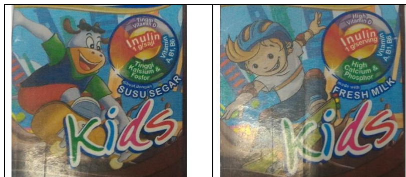
Gambar 1. Visualisasi Gambar Animasi Indomilk Kids rasa Coklat

Dalam penelitian ini terungkap terbentuknya universalitas peran gender pada kemasan produk susu Indomilk Kids dan Boneeto dalam ilustrasi gambar animasi yang ditampilkan. Kemasan susu rasa coklat dibarengi dengan ilustrasi gambar animasi yang identik dengan anak laki-laki dengan peran-perannya yang kental dengan maskulinitas.