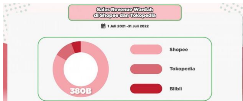
Gambar 1.1 Informasi penjualan brand Wardah di Shopee dan Tokopedia hingga 31 Juli 2022

terbayangkan betapa banyaknya peminat kosmetik Wardah ini. Diketahui Wardah tidak hanya menjual produknya di dalam negeri saja, tetapi juga mengekspor produknya. Pada periode Januari hingga Agustus 2020, Indonesia mampu mencatatkan nilai US$ 135,67 juta. Thailand dan Singapura adalah negara tujuan ekspor utama, masing-masing menyumbang 18,89 dan 16,58 persen dari ekspor global. Kali ini, Malaysia yang akan menerima kontainer ekspor berada di posisi ketiga dengan pangsa 10,71 persen. Filipina (9%) dan Jepang (6,04%) berada di urutan berikutnya.