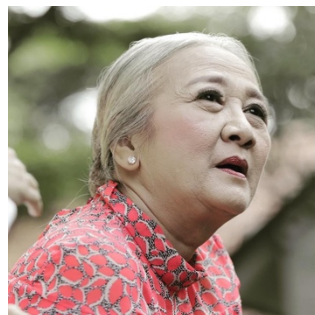
Gambar 3. 2 Yati Surachman

Dalam proses perancangan karakter, digunakan referensi tokoh nyata sebagai acuan visual dan emosional guna memperkuat representasi karakter yang dihasilkan. Pendekatan ini bertujuan untuk menciptakan karakter yang lebih realistis serta memiliki kedalaman ekspresi yang mampu menyampaikan pesan secara efektif kepada audiens. Karakter utama berupa lansia perempuan dikembangkan dengan mengacu pada figur publik Indonesia, yaitu Ibu Yati Surachman.