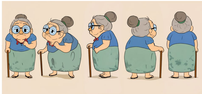
Gambar 3. 3 Karakter Nenek

Sementara itu, karakter pendukung berupa anak dikembangkan dengan mengacu pada figur publik Tara Basro.