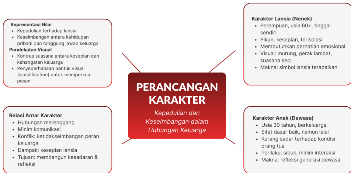
Gambar 3. 1 Mindmapping Perancangan Karakter

Berdasarkan kata kunci “kepedulian dan keseimbangan dalam hubungan keluarga”, peneliti menyusun mind mapping sebagai langkah awal dalam proses pengembangan konsep karakter. Melalui pendekatan ini, berbagai gagasan visual dan naratif dieksplorasi secara sistematis guna membentuk karakter yang mampu merepresentasikan kondisi emosional lansia serta relasi keluarga yang menyertainya.