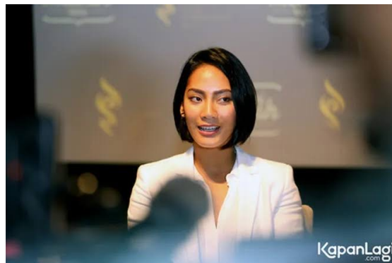
Gambar 3. 4 Tara Basro

Sementara itu, karakter pendukung berupa anak dikembangkan dengan mengacu pada figur publik Tara Basro.