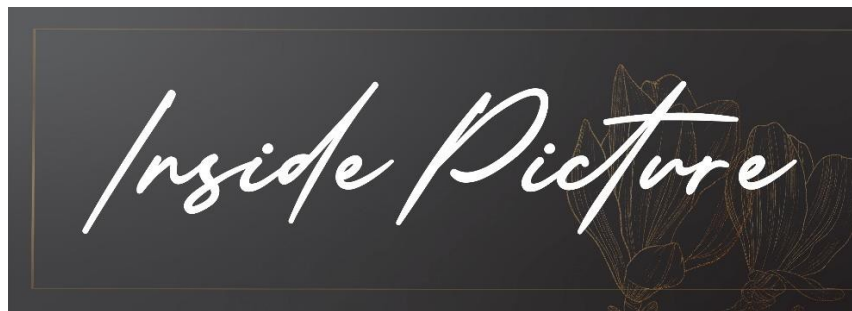
Gambar 4:Desain Sticker