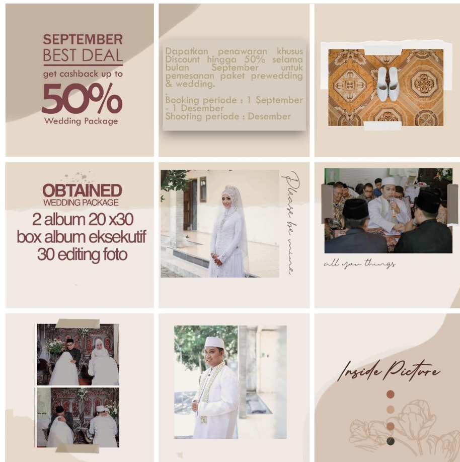
Gambar 1 : Desain Instagram Feeds