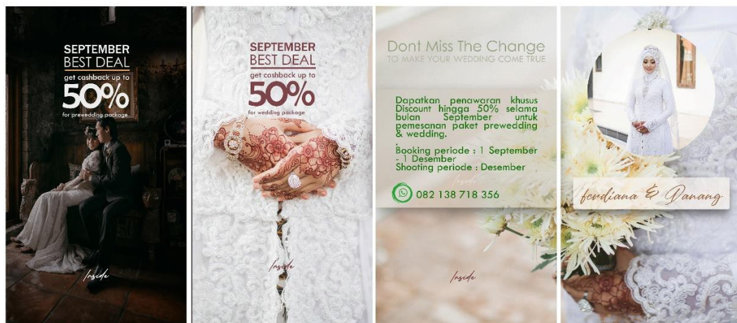
Gambar 2 : Desain Insta Story Ads