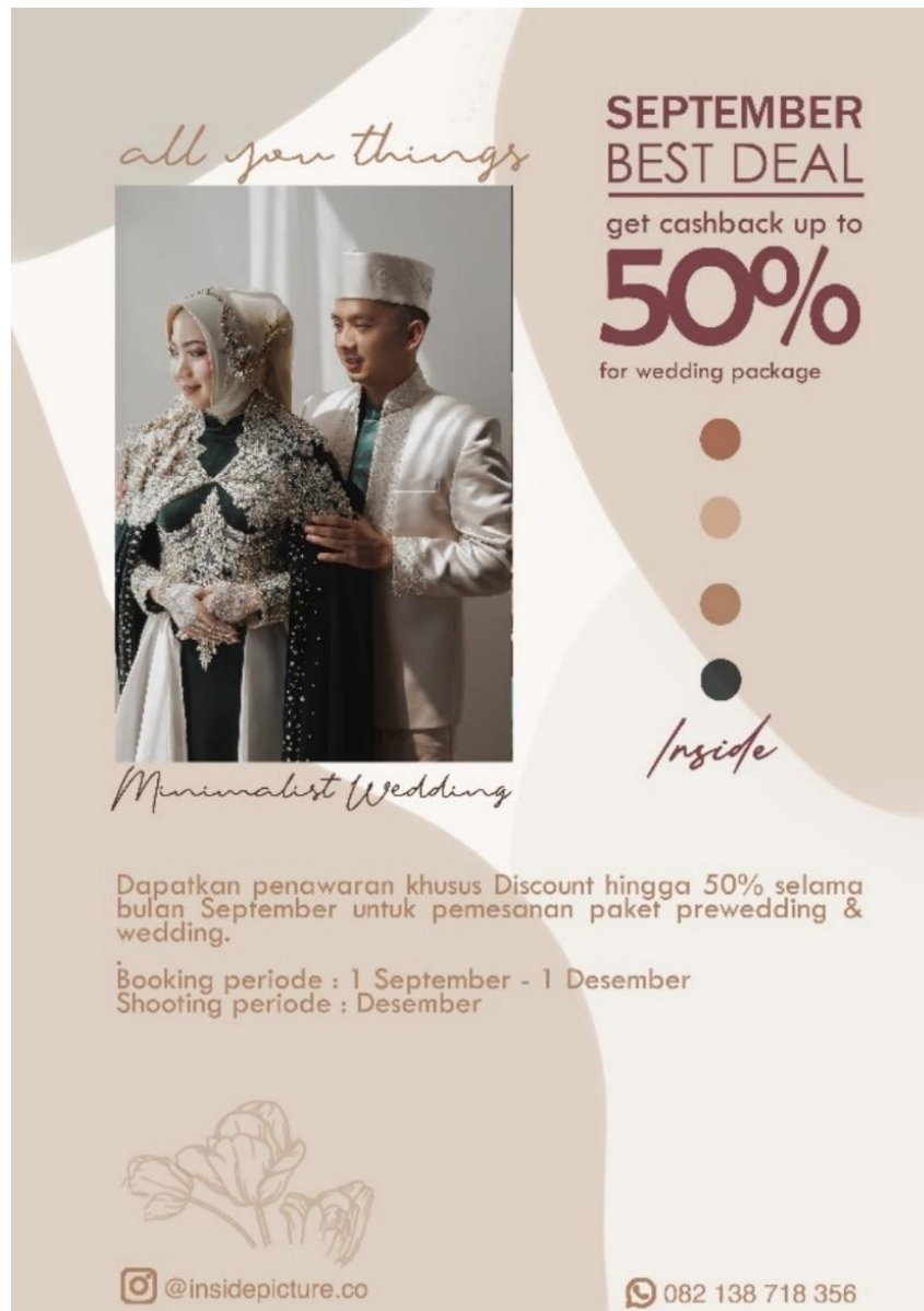
Gambar 5: Desain Flyer