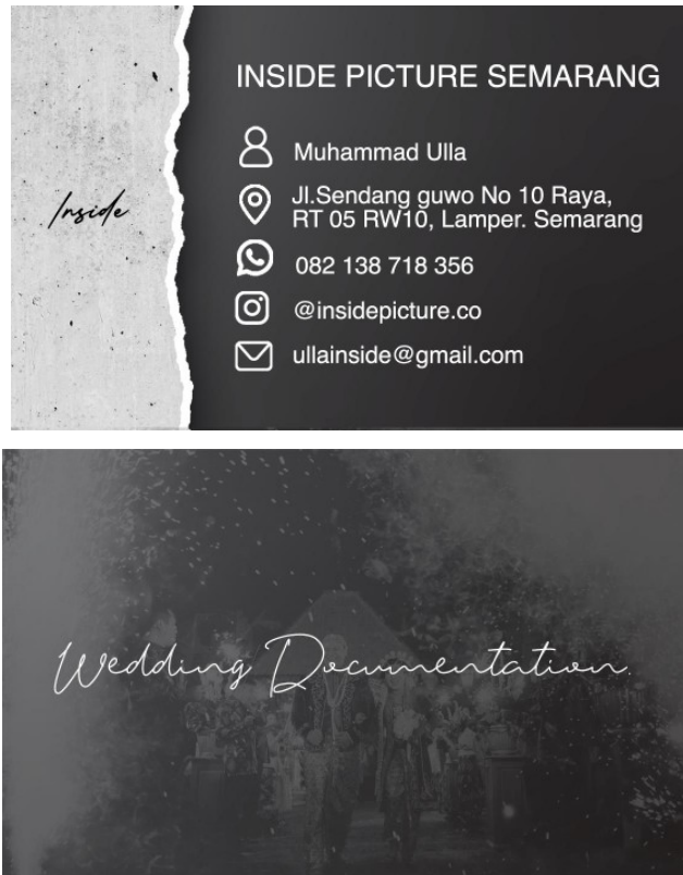
Gambar 3 : Kartu Nama