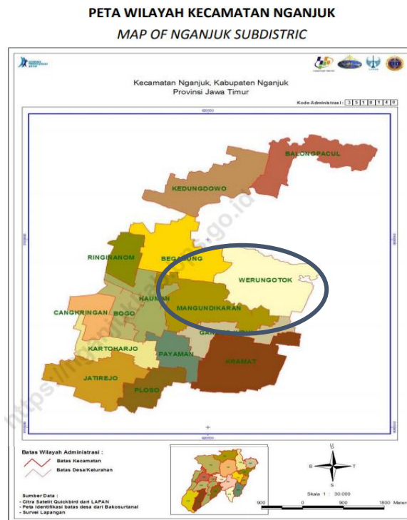
Gambar 1. Peta Kelurahan Mangundikaran dan Werungotok

Mangundikaran adalah kelurahan yang memiliki jumlah penduduk paling besar di Kecamatan Nganjuk dengan total 8757 penduduk pada tahun 2018. Sedangkan kelurahan Werungotok, jumlah penduduknya tertinggi ke 3 di Kecamatan nganjuk dengan total 6190 pada tahun 2018. Jumlah penduduk perempuannya juga yang paling tinggi di Kecamatan Nganjuk dengan angka masing-masing 4561 dan 3210 untuk Mangundikaran dan Werungotok. 9 Lokasi kelurahan Mangundikaran dan Werungotok juga berdekatan dan dapat dilihat pada gambar berikut.