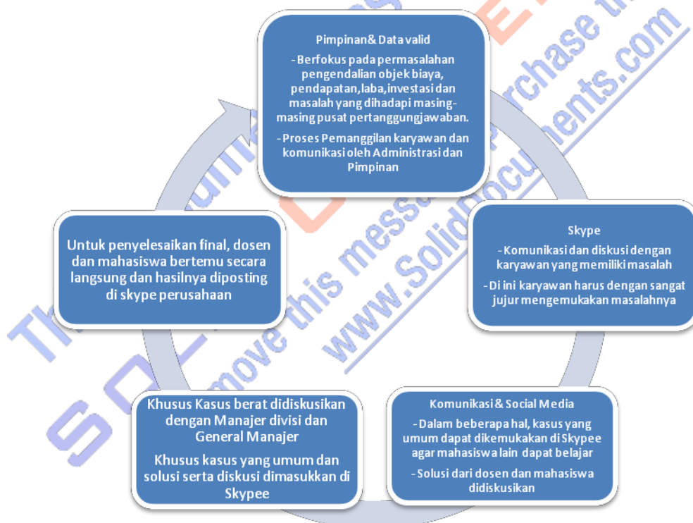
Gambar 4. Proses Sederhana Dalam Berkomunikasi Berbasis Solusi Di Skypee

Selanjutnya setelah data yang benar dimiliki oleh pimpinan tentang masalah yang dihadapi karyawan, maka Manajer divisi berkomunikasi dengan Manajer tingkat atas untuk melakukan koordinasi dan memanggil karyawan yang menghadapi masalah ataupun yang memberikan usulan penyelesaian untuk memberikan solusi dengan rapat antara karyawan atau pimpinan, juga dapat melakukannya lewat group yang telah dibuat. Jika karyawan tidak menanggapi maka pimpinan memiliki hak penuh sesuai dengan tata tertib dan peraturan yang telah ditetapkan oleh perusahaan untuk memberikan sanksi yang sesuai peraturan, jika karyawan melakukan komunikasi atau menghubungi kembali maka Parenting Accounting Responsibility systems versi 1.0 ini dapat dijalankan. Lebih jauh lagi pada saat menerapkan Parenting Systems Accounting Responsibility versi 1.0