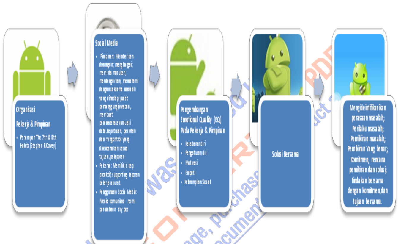
Gambar 1. Framework Parenting Systems Responsibility of Accounting Versi 1.0

berbasis pada teknologi informasi dan social media dapat digunakan untuk melakukan penghematan dana dalam implementasinya guna tercapainya komunikasi yang lancar antara bawahan dan atasan yang akan mengalokasikan biaya-biaya yang memperoleh manfaat daripadanya. Di bawah ini merupakan framework daripada parenting systems versi 1.0 yang akan diterapkan di dalam perusahaan terutama kepada pekerja dan pimpinan: