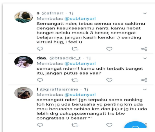
Gambar 5.5 balasan dari para followers

Berbagi keterbukaan diri atau masalah personal yang sedang dihadapi oleh individu ini dapat mempengaruhi secara psikologis yang nantinya dapat meringankan serta menerima masukan dari orang lain yang terlibat dalam keterbukaan diri individu tersebut. Saat seseorang mengalami ketegangan akibat terlibat suatu masalah lebih baik untuk diungkapkan apabila tidak akan menimbulkan eksplosif atau amarah yang mudah meledak, sebaliknya jika diungkapkan individu tersebut dapat menemukan solusi dan lebih merasa lega (Ningsih, 2015).