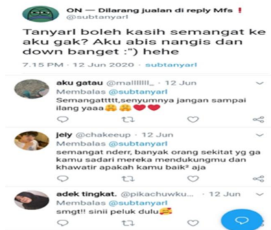
Gambar 5.1 salah satu isi pesan di akun autobase @subtanyarl

Terlihat pada gambar 5.1 dibawah ini, dimana terlihat salah satu sender membagikan pesan atau cuitan yang meminta para followers akun ini untuk menyemangati dirinya karena sedang down atau sedih, lalu para followers akun @subtanyarl membalas dengan kata kata penuh perhatian agar si sender dapat semangat kembali. Hal tersebut sudah sesuai dengan apa yang diharapkan oleh Kiki selaku pendiri dari autobase ini.