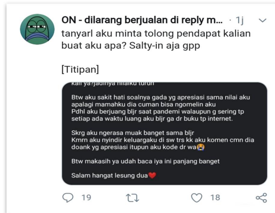
Gambar 5.4 senders yang membagikan kisah pribadinya