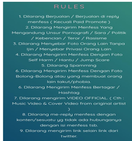
Gambar 5.2 aturan yang dibuat oleh admin