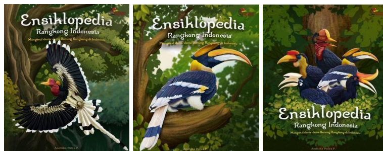
Gambar 5. Desain terpilih Judul Buku