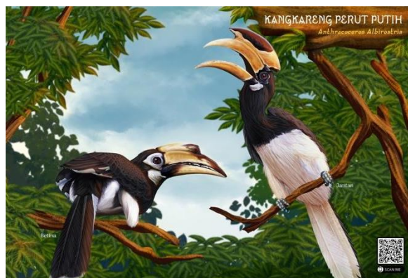
Gambar 2. Contoh Ilustrasi

Berdasarkan hasil kuesioner dan wawancara didapatkan konsep visual sebagai berikut; a) ilustrasi yang digunakan pada buku akan menggunakan gaya realis dan naturalis menggunakan teknik digital painting mengikuti dari keyword “Mengenal Petani Hutan Indonesia” maka di dalam buku ini terdapat ilustrasi dari burung Rangkong serta suasana hutan tropis sebagai environment pendukung agar anak dapat lebih mengerti tentang burung Rangkong di habitat aslinya. Pembuatan ilustrasi akan menggunakan acuan visual dengan sample objek dari gambar foto menjadi bentuk ilustrasi yang semirip mungkin dengan objek tersebut. b) Warna yang digunakan dalam perancangan buku ilustrasi ensiklopedia jenis-jenis burung Rangkong di Indonesia mengacu pada hasil riset burung Rangkong memiliki warna bulu dominasi hitam dan warna mencolok seperti kuning, biru, dan merah di beberapa bagian tubuh, maka warna dalam buku akan didominasi dengan warna hitam dan warna mencolok agar warnanya kontras seperti warna bulu burung Rangkong.