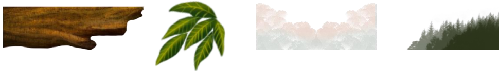
Gambar 6. Desain Supergrafis