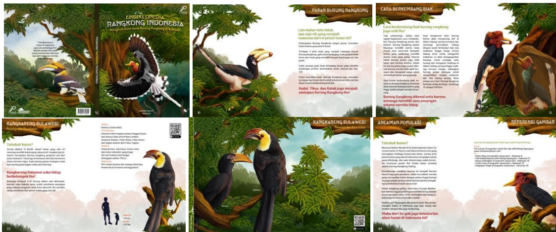
Gambar 7. Desain isi Buku

Setelah menemukan desain yang sesuai dengan keyword perancangan, kemudian desain yang terpilih diterapkan pada media utama dalam perancangan. Pada tahap akhir ini media utama sudah siap untuk diproduksi dan dipublikasikan secara luas kepada target audience yaitu anak-anak usia sekolah dasar.