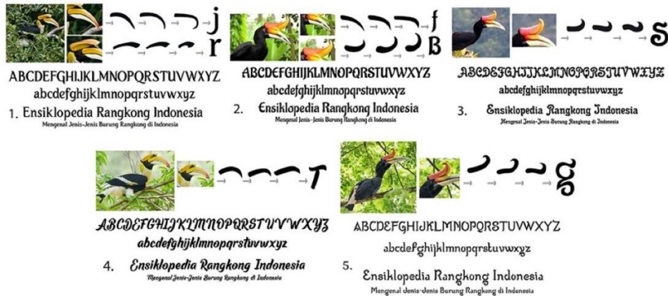
Gambar 3. Alternatif Judul Buku

Desain terpilih dari alternatif di atas yaitu font bernama Wizzta dengan ukuran 40, 36, 24.5 untuk diimplementasikan pada judul buku.